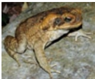
2. Aga-Kröte in Australien