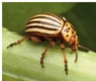
3. Kartoffelkäfer in Europa

Verfasst einen kurzen Bericht und präsentiert ihn vor der Klasse.