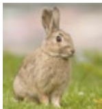
1. Wildkaninchen in Australien

Bildet drei Gruppen und recherchiert im Internet jeweils einen der folgenden Fälle: